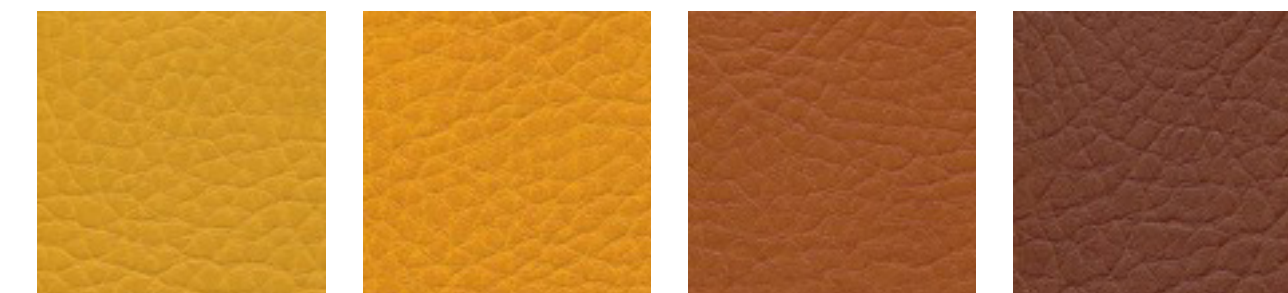
safran F5070909 mango F5070636 sherry F5070644 marone F5070640