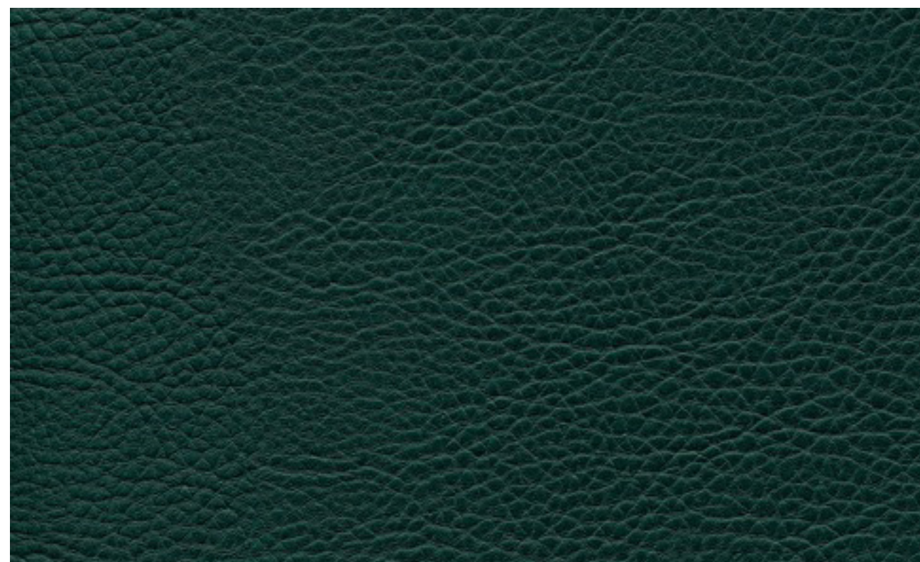
skai® Sotega forest F5070763

Un material de tapizado skai® de alta calidad con sensaciones de napa flexible y un grano de cuero clásico. Gracias a su estética y su tacto naturales, este material apenas se distingue del cuero auténtico.