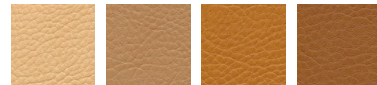
camel F5070635 sattel F5070647 nature F5071124 fuchsgold F5070693