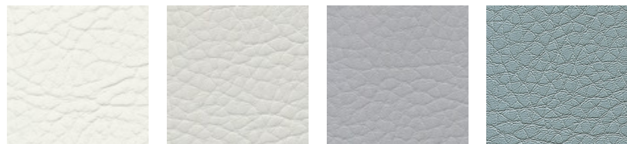
weiss F5070646 lightgrey F5071019 silvergrey F5071020 denim F5071189