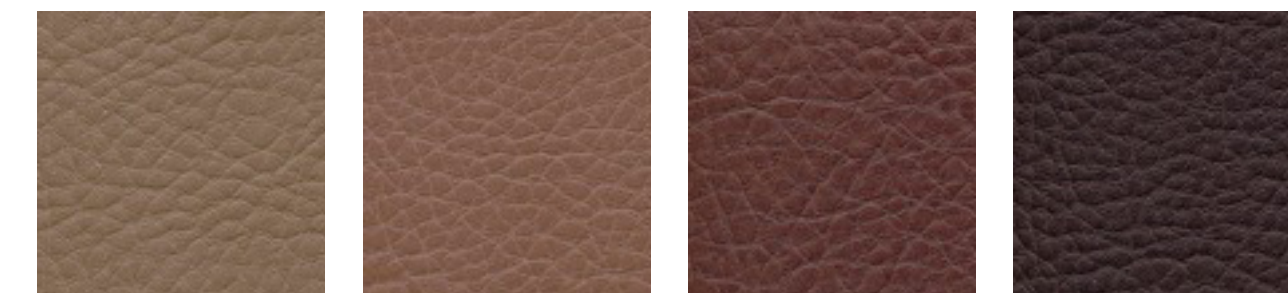
smoke F5070835 hazelnut F5071174 mocca F5070641 schoko F5070679