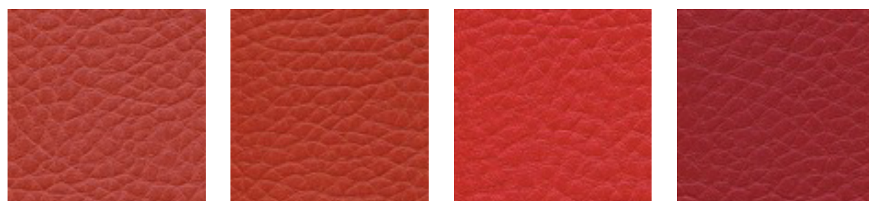
arancio F5070639 lachs F5070910 flame F5070637 kirsche F5070680