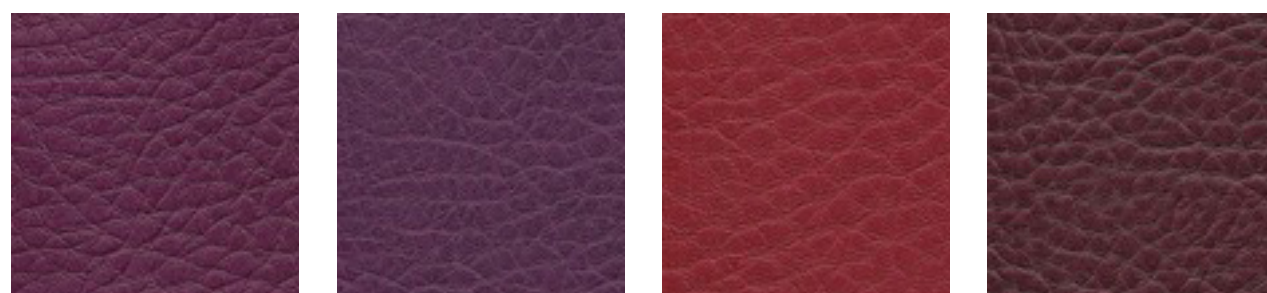
cyclam F5071126 amethyst F5070912 carmin F5070638 bordeaux F5070677