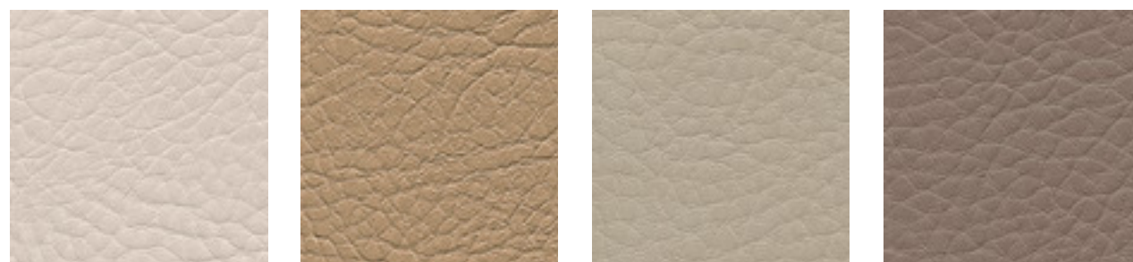
perle F5070911 sand F5071187 birke F5070767 fango F5071091