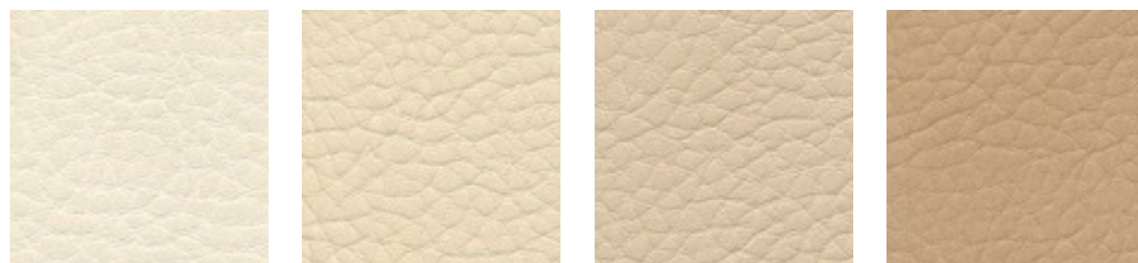
hellbeige F5070645 sandbeige F5071065 beige F5071173 kiesel F5071090