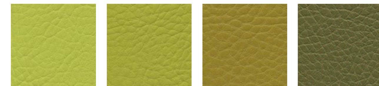
lightolive F5071016 limone F5071017 olive F5071125 taiga F5071188